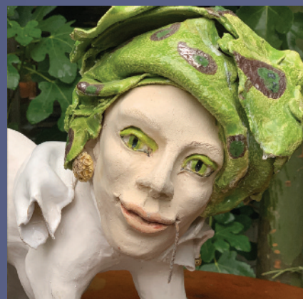
La Diva, pigmenten, engobes, glazuur, met leer, metaal, sieraden, 45 x 40 cm.