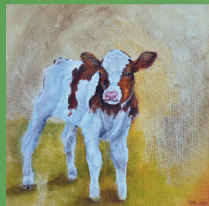
Kalfje Johan, olie op doek, 40 x 40 cm.