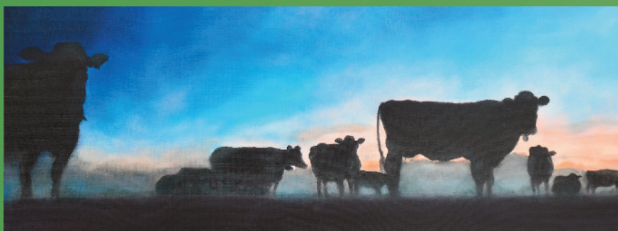
Onze koeien in de avond nevel, olie op doek, 100 x 70 cm.