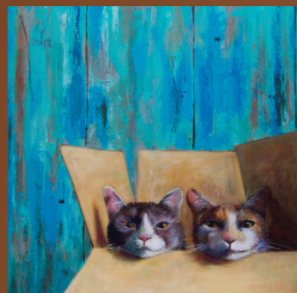
Poezen in doos, acryl op linnen, 100 x 100 cm