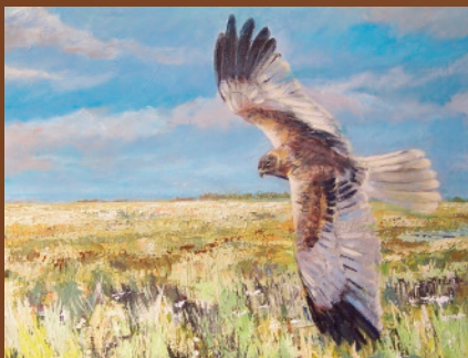
Op jacht (buizerd), acryl op linnen, 90 x 100 cm