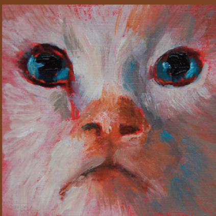
Poezenportretje op een blokje hout, olieverf, 7 x 7 x 2 cm