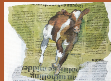
Kalf, acryl collage op doek, 30 x 30 cm