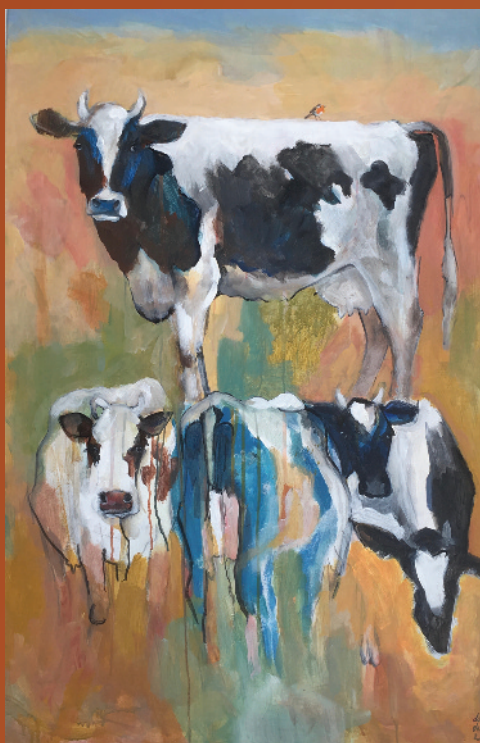
Koeienstapel, acryl op doek, 80 x 100 cm