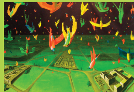
The birds, acryl op doek, 250 x 175 cm, 2012

Wanneer je de felgekleurde werken van Jakob de Jonge bekijkt, komt het gevoel bovendien dat je te maken hebt met een geëngageerd kunstenaar. Dat gevoel wordt bevestigd wanneer je met hem praat. Hij is dan ook opgevoed met de opvatting dat je een nuttige invulling hoort te geven aan het leven.