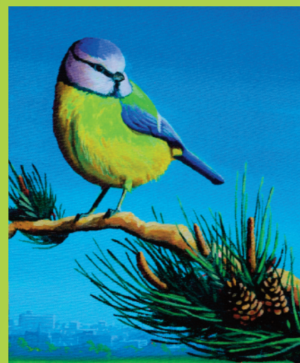
Rafael, acryl op doek, 40 x 30 cm, 2015