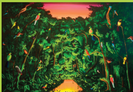
Les innocents, acryl op doek, 170 x 240 cm, 2014