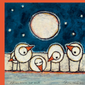
'Between heaven and earth...', 60 x 60 cm, 2011