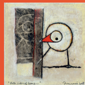
'Both sides of being...', 40 x 40 cm, 2008